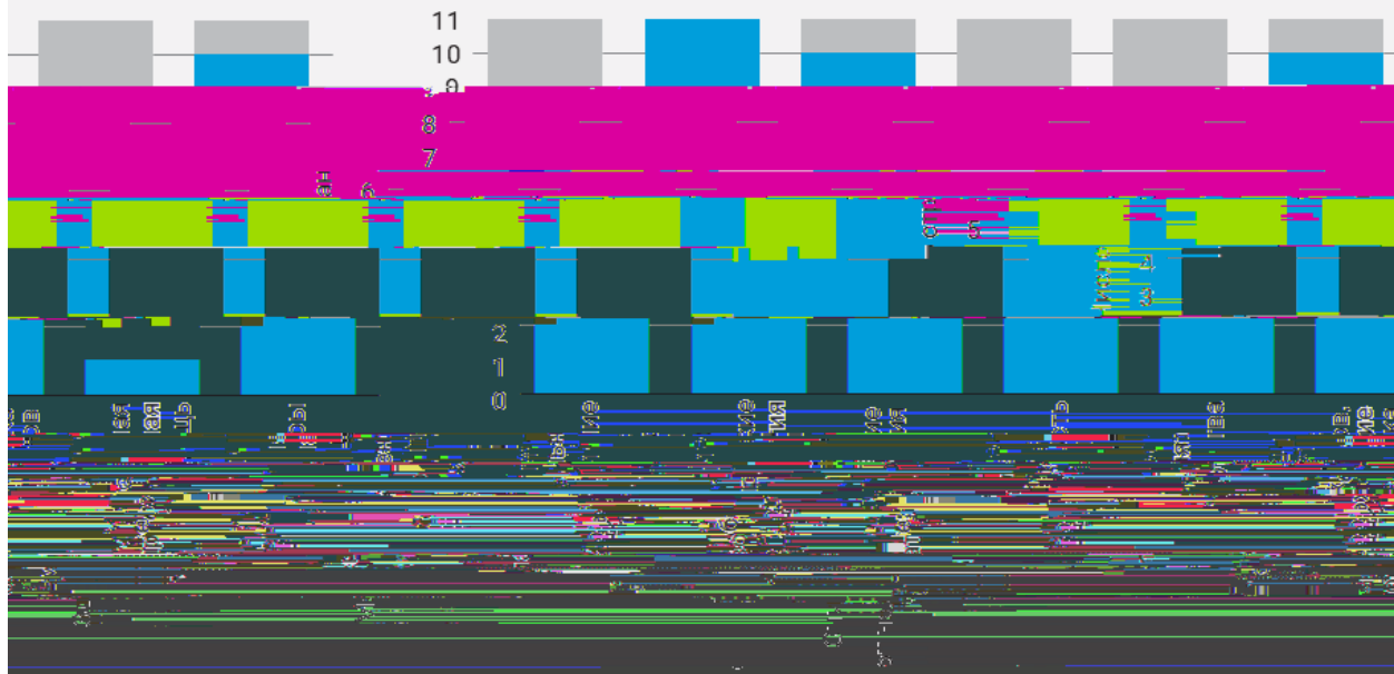
РИСУНОК 6. СФЕРЫ ОХВАТА ВАЖНЫХ ПАКЕТАМИ МЕР НАЛОГОВО-

■ Число стран, объявивших о намерении ■ Число стран, объявивших о намерении ■ Число стран, по ■ охватить эти области своими ■ охватить эти области своими