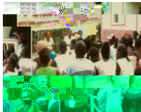
&HUF0H G¶pFRXWH GDC de Limbé en compagnie des hommes et des autorités locales .

femmes ainsi que les Maires des communes impliquées dans le projet, ont contribué à construire un climat de bonne gouvernance locale et à renforcer la citoyenneté des femmes. 'HV OHDGHUV pPHUJHQWV G¶RU en Zone Durable Rurale bénéficié de PPHV