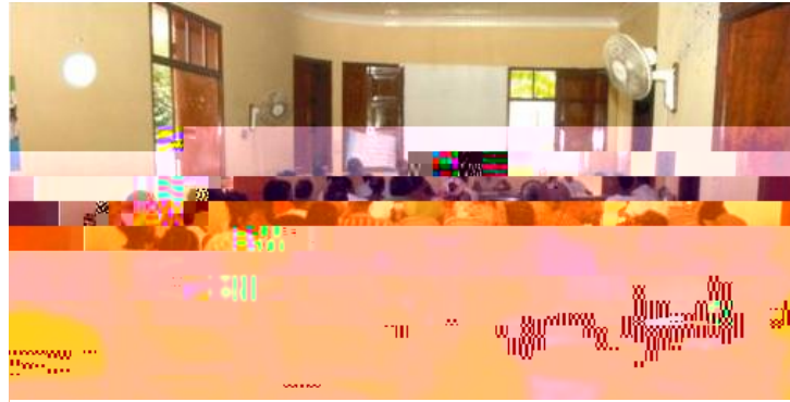
de quelques représentants de la Société Civile locale

La participation politique des femmes a été sans doute le point fort du projet. Chaque cercle a été conduit